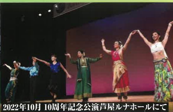
2022年10月 10周年記念公演芦屋ルナホールにて