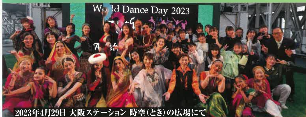
2023年4月29日 大阪ステーション 時空(とき)の広場にて

CID-UNESCO芦屋セクション 090-1246-2725(ナリニ) 090-1442-3898(西川)